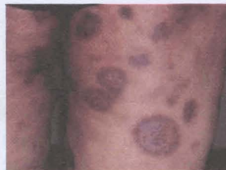
شکل ۱- ضایعات پوستی متعدد در دو نمای کمره شده از باسن‌ها.