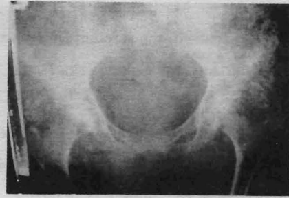
شکل ۳- چند توده کلسیفیه در نمای تهیه شده از ابتدای بازوی راست و همچنین نقاط پراکنده و منتشر در نامیه لگن مشاهده می‌شود.

تا خیر در تشخیص و درمان این بیماران باعث عوارض جدی متعدد مثل رسوب کلسیم در مفاصل ( که خود باعث تخریب سینوویوم و محدودیت شدید حرکتی می‌شود )، رسوب در بافت عصبی (که آنهم باعث ایجاد پاراستزی و درد شدید می‌گردد)، انسداد عروق و گانگرن و در نتیجه عفونت ثانویه می‌شود (۱۴-۱۵).